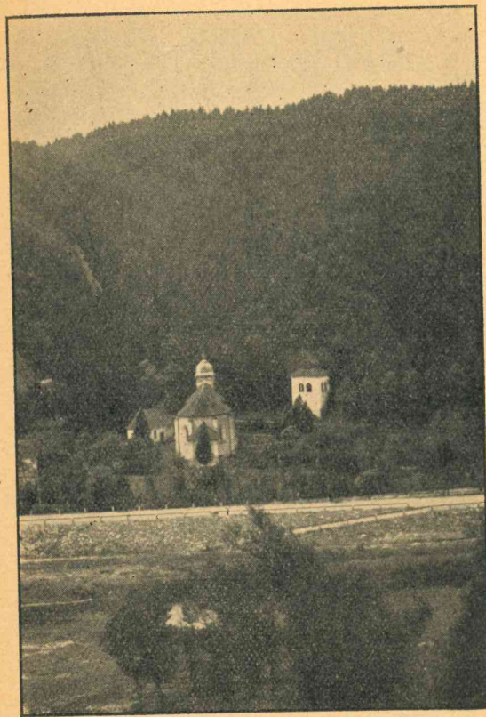
Svatokilianský farní kostel se zvonící.

Z bývalých budov klášterních zachoval se jediný viditelný zbytek na straně východní. Jest to část zřícené valeně, klenuté chodby a kusy zdiva z lámaného kamene. Tam, kde klášter stával, rozprostírají se pole. Při jejich okraji, nad zmíněnými troskami, stojí pod košatými stromy železný