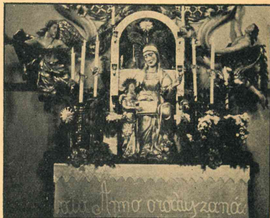
Milostná socha sv. Anny.