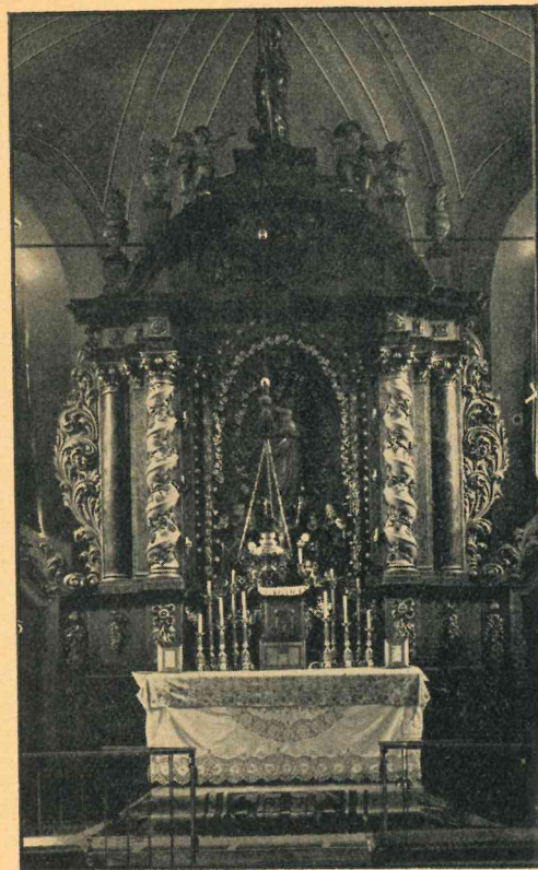
Hlavní oltář kostela svatokilianského.

Svatý Kilian pocházel ze vznešeného rodu ve Skotsku, kde se narodil kolem roku 644. Vstoupil